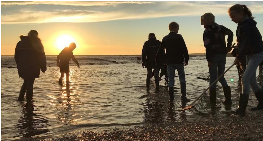
Schoolkamp groep 8 op Schiermonnikoog

Een jarige leerling mag trakteren in de klas. De school geeft de voorkeur aan gezonde traktaties. Daarnaast trakteren de leerlingen vanuit een jarenlange traditie de school op kleine financiële bijdrage van een paar euro. Dit geld komt in de 'pleinpot' en wordt besteed aan speelgoed op het plein. Deze traditie is geheel vrijblijvend en in plaats van een traktatie voor meesters en juffen.